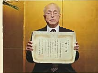
一般社団法人千葉県建設業協会 様