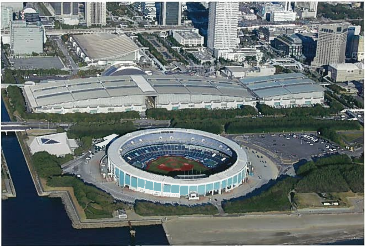
幕張メッセ（東京オリンピック・パラリンピック開催地）