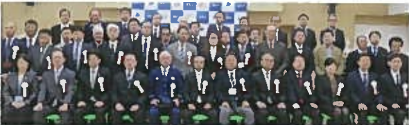
◆ 商店会からの暴力団排除 浦安市商店会連合会暴力団排除宣言式 (令和元年11月25日)