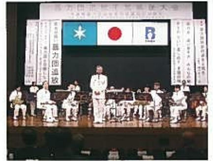
千葉県警察音楽隊