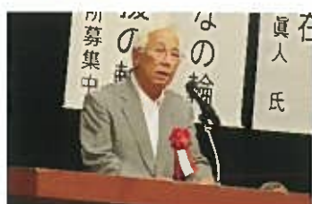
伊藤千葉県公安委員会委員長様