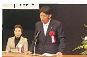
小見山千葉県弁護士会会長様