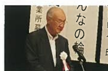
安藤県民会議理事長