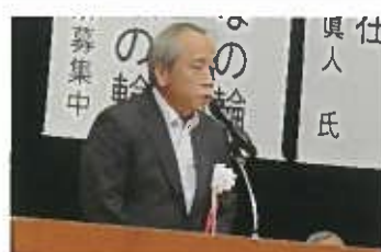
早川千葉県警察本部長