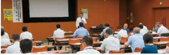
■令和6年度銚子市暴力団排除対策協議会総会 (令和6年8月2日)