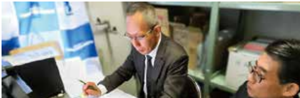
■不当要求防止責任者講習(オンライン) (令和6年11月20日)