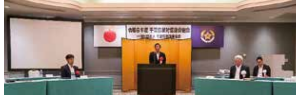
■令和6年度千葉県警備業協会暴力団等反社会的勢力排除対策協議会総会 (令和6年10月11日)