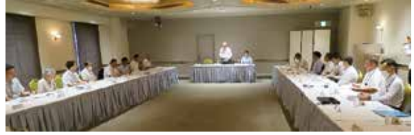
■令和6年度暴力団社会復帰対策協議会総会 (令和6年7月24日)