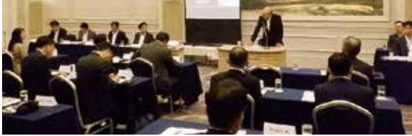
■令和6年度千葉県生保警察連絡協議会・総会 (令和6年10月10日)