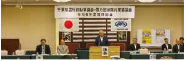
■千葉県霊柩自動車協会暴力団排除対策協議会定時総会 (令和6年7月3日)