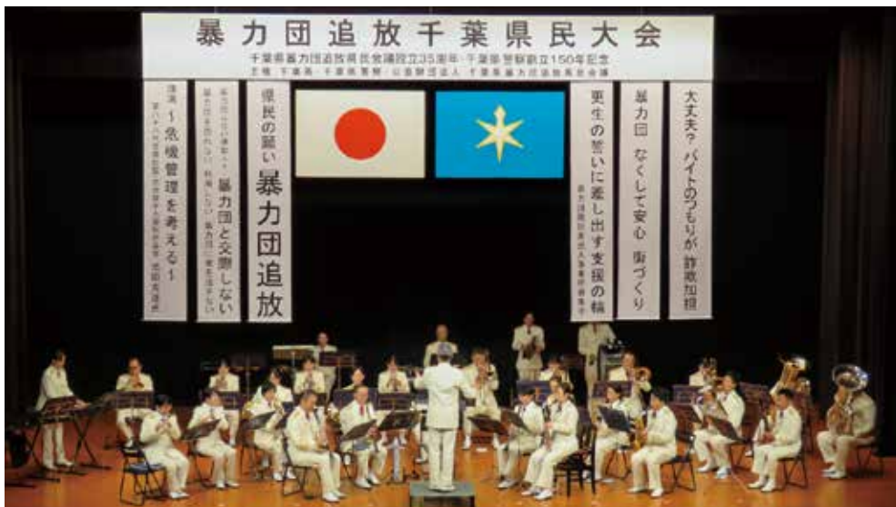
千葉県警創立150年を記念し作曲された、新しい行進曲「SALUTÉ・夢をのせて」などを演奏しました。