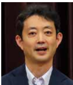
熊谷 俊人 千葉県知事