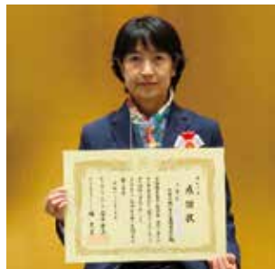
千葉県銀行警察連絡協議会 様