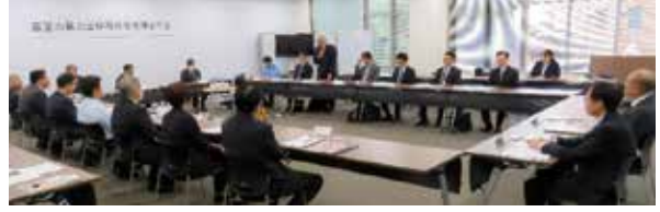
■令和6年度富里市暴力団排除対策協議会総会 (令和6年10月21日)