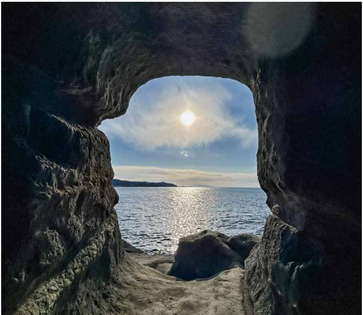
洞窟から見る海（館山市）