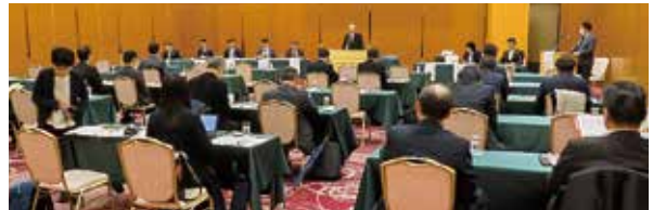
■千和6年度千葉県損害保険防犯対策協議会総会 (令和6年11月20日)