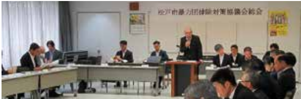
■令和6年度松戸市暴力団排除対策協議会総会 (令和6年10月28日)