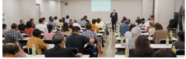
■少年指導委員研修会 (令和6年10月7日)