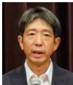
宮沢 忠孝 千葉県警察本部長