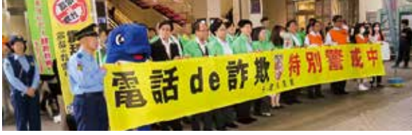
■千葉県生保警察連絡協議会(電話de詐欺被害防止街頭PR活動) (令和6年10月17日)