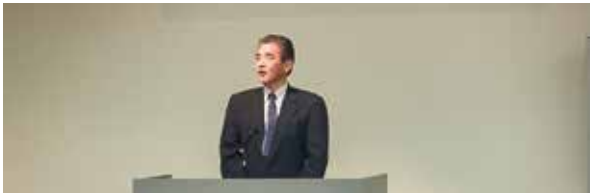
■UR都市機構千葉県暴力団等排除対策協議会令和6年度総会 (令和6年11月22日)