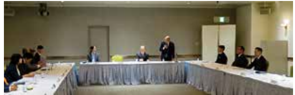
■千葉県民事介入暴力対策拡大協議会 (令和6年11月6日)